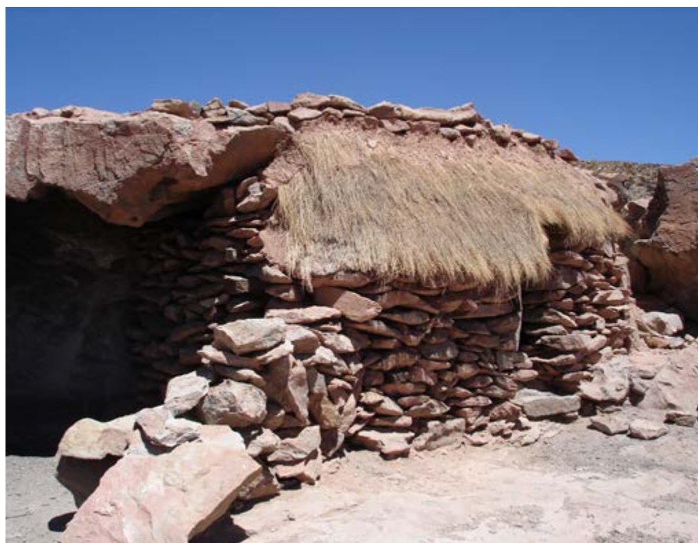
Detalle de un puesto adosado a un alero.

se constituyen como tales en una acumulación de tiempos, de las presencias, y de los entramados de memorias. Los lugares dentro de los pastoreos se vuelven significativos en relación con las acciones presentes y pasadas que allí se desarrollaron, de las huellas y arquitecturas de los abuelos en estas porciones del espacio. En este marco, es necesario observar que las movi- lidades estacionales están ciertamente vinculadas con el aprovechamiento de las pasturas para la supervivencia de los re- baños, pero no es menos importante que al recorrer el territorio se están vinculado los lugares de los antepasados. Entonces, el desplazamiento ya no es solo espacial sino también temporal. El paisaje, con sus lugares , refuerza las tramas de relaciones entre las personas dentro de sus líneas de descendencia (Bender, 1999). De esta ma- nera, la idea de paisaje toma distancia de la dimensión escénica esteticista carac- terística de su conformación inicial como concepto geográfico (Zusman, 2008), para enriquecerse con una comprensión que permite observarlo como un actor central en la vida de las personas (Thomas, 2001).