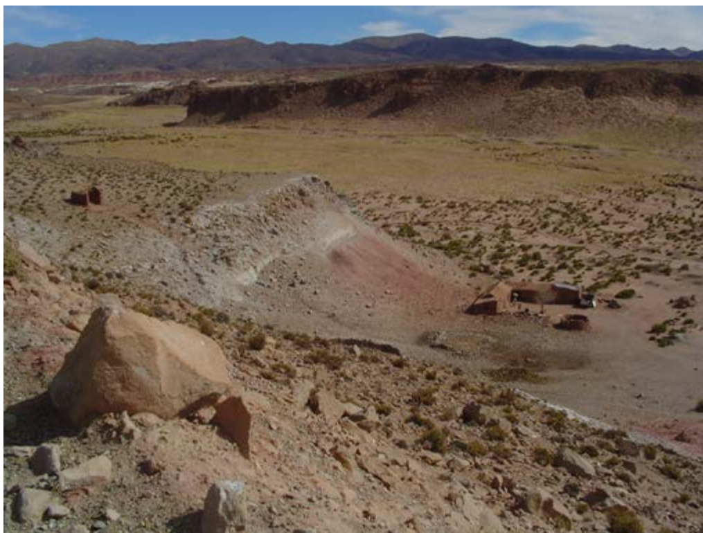
Emplazamiento de un domicilio dentro de un pastoreo .