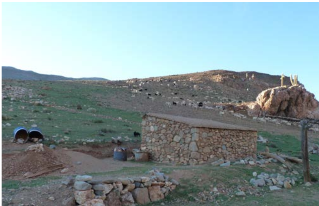
Vista de uno de los puestos de pastoreo, con los recintos en el primer plano y los corrales vinculados a una peña.