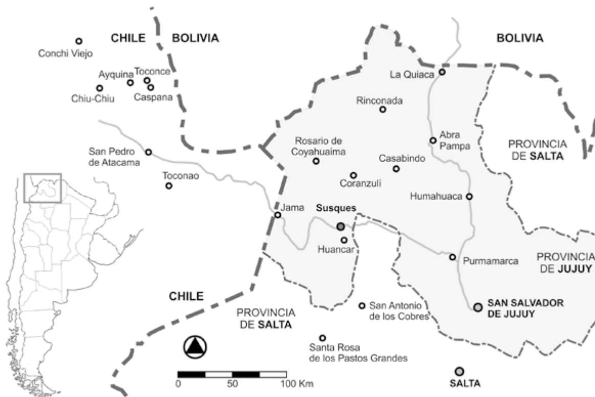
Ubicación de Susques dentro de la provincia de Jujuy. Elaboración propia.

rural de unas 130.000 hectáreas donde las diferentes unidades domésticas que conforman la comunidad desarrollan sus actividades pastoriles. En términos ambientales, el clima es el usual de las estepas de altura siendo frío y seco con escasas aunque torrenciales precipitaciones concentradas de diciembre a marzo.