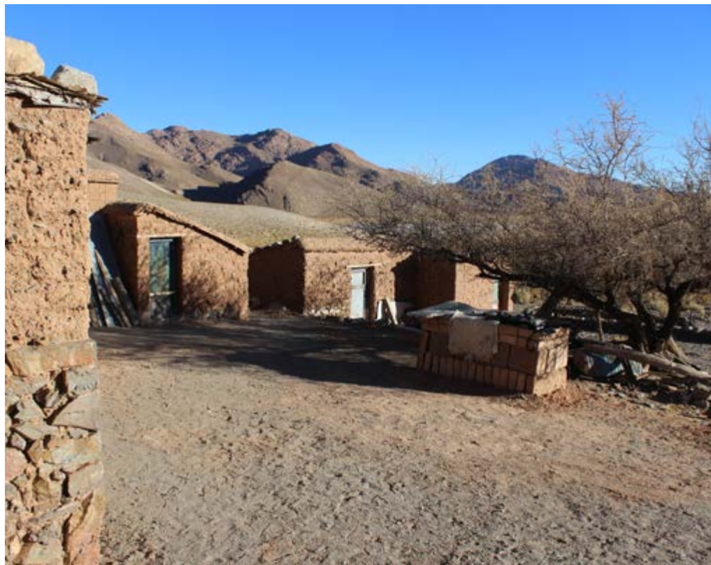
Vista del patio como espacio organizador del domicilio