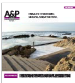
Imagen de tapa : Alvaro Siza, Piscina das Marés , Leça da Palmeira, Matoshinhos, Oporto.