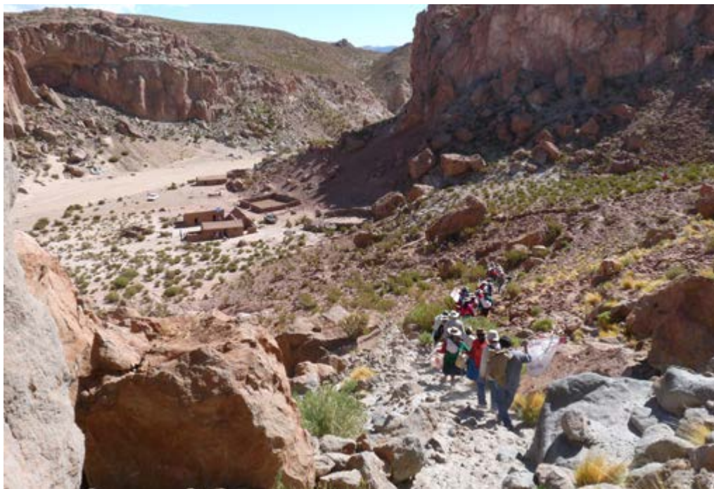
Las cuadrillas del carnaval llegando a uno de los domicilios cercanos a Susques.

La propia conformación espacial de los domicilios es clave para comprender su rol social. A diferencia de los puestos , estos se conforman a partir de la suma de una cierta cantidad de recintos más o menos independientes que se organizan teniendo al patio como espacio articulador. Estos distintos recintos son el resultado de un proceso de construcción en el tiempo, tal que las diferentes generaciones han sumado a una suerte de proyecto colectivo. En este sentido, en el domicilio se concentra la genealogía del grupo doméstico y se reconoce la pertenencia de una persona dentro de su línea de descendencia. Tal como se puede observar, en la casa se reconoce la misma lógica de organización espacial y temporal del paisaje pastoril.