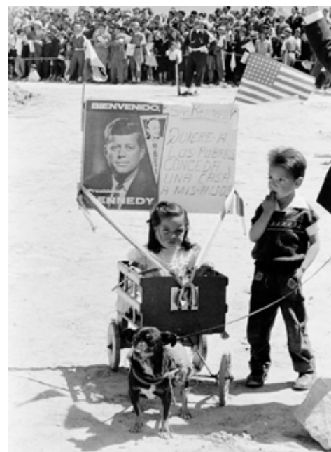
Figura 3. Foto de niños esperando por Kennedy, Cecil Stoughton. Fuente: White House Photographs. John F. Kennedy Presidential Library and Museum, Boston.

L.B. Para mí, el concepto de zona de contacto fue particularmente útil porque permitía desplazar una lectura más estructural –o del