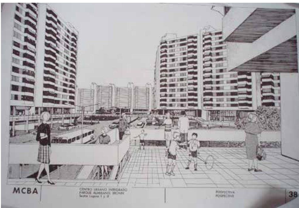
Figura 1. Vila Kennedy, Companhia de Habitação Popular do Estado da Guanabara. A COHAB através de números e imagens. Rio de Janeiro: COHAB, 1965. Mimeo. | Figura 2. Municipalidad de la Ciudad de Buenos Aires, Solicitud de préstamo al Banco Interamericano de Desarrollo. Buenos Aires: Municipalidad de la Ciudad de Buenos Aires, 1965.

la cuestión de la ciudad y la vivienda en la segunda posguerra. Uno de los libros que más me marcó en ese momento fue Close Encounters of Empire , editado por Gilbert Joseph, Ricardo Salvatore y Catherine LeGrand (1998). En su introducción, Joseph propone repensar la hegemonía y el imperialismo (es decir, cómo se producen concretamente las relaciones asimétricas de poder) alejándose de las lecturas más tradicionales de centro-periferia y del dependentismo.