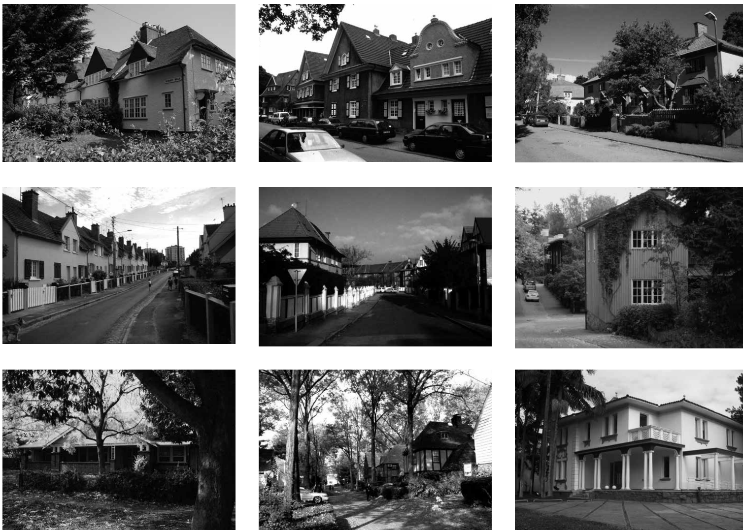
Figura 3. Desde su formación y primeros esfuerzos en Gran Bretaña, las ideas y prácticas del movimiento Garden City se difundieron rápidamente, con numerosas adaptaciones locales, por todo el mundo a comienzos del siglo XX, como sugieren estos ejemplos. De arriba a abajo: Letchworth Garden City , Hertfordshire, Reino Unido, desarrollada a partir de 1903, muestra las primeras viviendas obreras construidas para la Howard Cottage Society , 1911-12. Margarethenhöhe , Essen (Alemania), desarrollada desde 1909 por una fundación controlada por la familia de industriales Krupp, muestra algunas de las primeras viviendas (c. 1912). Enskede , Estocolmo (Suecia), urbanizado desde 1908 por el ayuntamiento, con algunas de las primeras viviendas en hilera, aunque posteriormente se construyeron viviendas unifamiliares o adosadas. Chemin Vert , Reims (Francia), construido entre 1920 y 1924 por una sociedad filantrópica fundada por industriales locales para mejorar la vivienda obrera y contribuir a la reconstrucción de la ciudad devastada por la guerra. Ořechovka , Praga, Checoslovaquia (actual República Checa), suburbio ajardinado de clase media, desarrollado entre 1919 y 1925 por la Cooperativa de Construcción de Funcionarios Públicos. Käpylä , Helsinki (Finlandia), suburbio ajardinado con viviendas de madera de bajo coste, construido entre 1920 y 1925 con apoyo municipal para paliar la escasez crónica de vivienda. Colonel Light Gardens , Adelaida (Australia), propuesto como "suburbio ajardinado modelo" por el gobierno del estado de Australia Meridional en 1917 y desarrollado por una comisión estatal, 1921-27. Radburn , Nueva Jersey (EE. UU.), desarrollado desde 1929 como comunidad ajardinada para la era del automóvil por la City Housing Corporation de dividendos limitados, pero pronto abortado por el crack de Wall Street. Jardim América , São Paulo (Brasil), diseñado en 1915 por los planificadores de Letchworth y desarrollado por una compañía privada de tierras como suburbio ajardinado exclusivo de alto nivel, 1915-29.