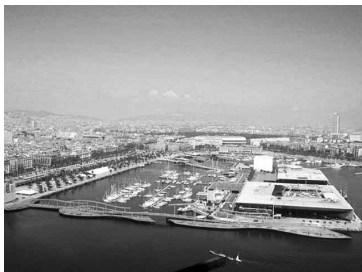
Figura 1. El modelo de desarrollo del frente marítimo, centrado en el ocio, el turismo y la cultura, se asoció especialmente con Baltimore a comienzos de la década de 1980 y fue rápidamente emulado en todo el mundo. Los demás ejemplos mostrados tienen vínculos directos con Baltimore, asociados de manera diversa a la participación de promotores, arquitectos y planificadores. De arriba a abajo: Inner Harbor, Baltimore, EE. UU. Los proyectos anteriores contenían elementos del mismo enfoque, pero este fue el primero en ofrecer toda la gama de atracciones, utilizado explícitamente para regenerar una ciudad en declive | Darling Harbour, Sídney, Australia. Inaugurado en 1988, siguió de cerca el modelo de Baltimore para reutilizar una parte obsoleta de la ciudad en ocasión del bicentenario nacional | Tempozan Harbor Village, Osaka, Japón. Aunque su aspecto difiere bastante del de Baltimore, este proyecto costero, inaugurado en 1991, estuvo estrechamente vinculado al concepto de desarrollo de Baltimore y contó con algunos de los mismos arquitectos | Port Vell, Barcelona, España. La creación de esta "ciudad de la diversión" en la antigua zona portuaria fue otro préstamo del concepto de desarrollo y planificación de Baltimore. Se inauguró a tiempo para los Juegos Olímpicos de Verano de 1992.