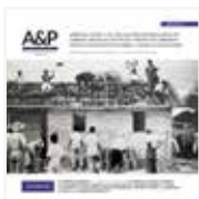
Imagen de tapa:

Casa experimental.