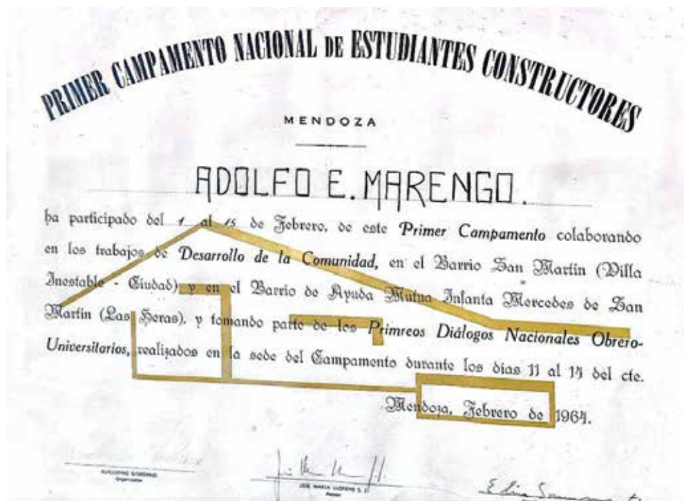
Figura 5. Certificado de participación en que se aprecia el nombre de los campamentos.

Como hemos podido analizar a lo largo del presente trabajo, una rama de la Iglesia católica se sensibilizó frente a la cuestión social en América Latina. Debido a este interés se transformó en un actor activo en la producción social del hábitat popular como una manera de mitigar la desigualdad y colaborar en la dignificación de los sectores menos favorecidos, por lo que su accionar trascendió la actividad pastoral para involucrarse materialmente con los problemas de los asentamientos de los cordones urbanos. Fue un actor activo en la transformación de sectores periféricos y en la consolidación e integración. En este contexto, se destaca a nivel local la figura del cura José María Llorens, quien, en Mendoza, mediante su instalación en un asentamiento, acompañó activamente su