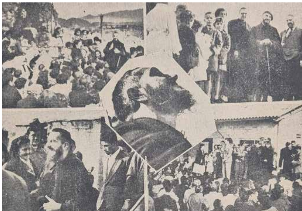
Figura 1. Fotos de la gira del Abbe Pierre por diferentes barrios de Mendoza. ("Antes de dejar Mendoza el Padre Pierre visitó los barrios humildes", 1959)

La preocupación programática de la Iglesia por los sectores más desfavorecidos tuvo sus comienzos hacia fines del siglo XIX, lo que se evidencia en la encíclica Rerum Novarum , elaborada por el Papa León XIII en 1891, que marcó los primeros lineamientos y guio la actuación en materia social. La solución a la desigualdad se encontraba en la intervención de la doctrina de justicia y caridad cristianas que, a su vez, serviría de inspiración a la actuación del Estado (Blanco, 2021). Posteriormente, la encíclica