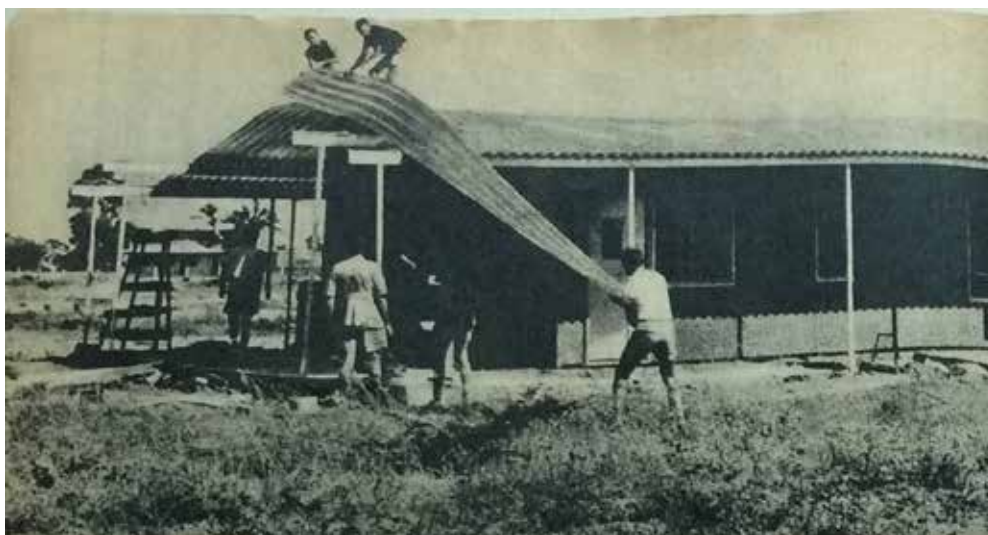
Figura 6. Jóvenes del CUT colaborando a techar una vivienda. | Figura 7. Mujeres trabajando en el zanjeo para cimientos de una vivienda.