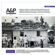
Imagen de tapa:

Casa experimental.