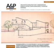
Imagen de tapa: Proyecto casa Jotimliansky. Frag- mento de corte longitudinal. Lápiz de color sobre copia heliográfica.