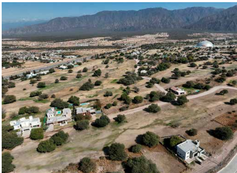
Figura 4. Vivienda social en la zona sur.