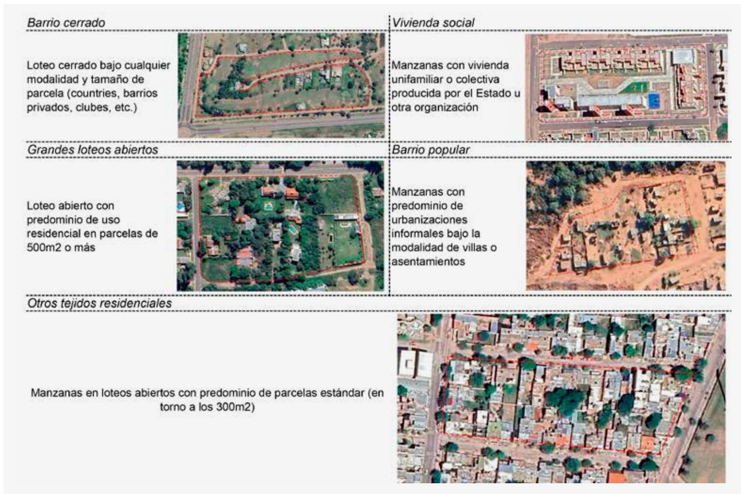
Figura 1. Categorías de clasificación de los usos residenciales.

Cabe señalar que el uso de la densidad como indicador requiere cautela, dado que se trata de una medida particularmente sensible a los criterios de delimitación de la aglomeración (Rodríguez y Kozak, 2014). En este sentido, su incorporación en el presente trabajo tiene un carácter exploratorio y comparativo entre los cortes temporales definidos.