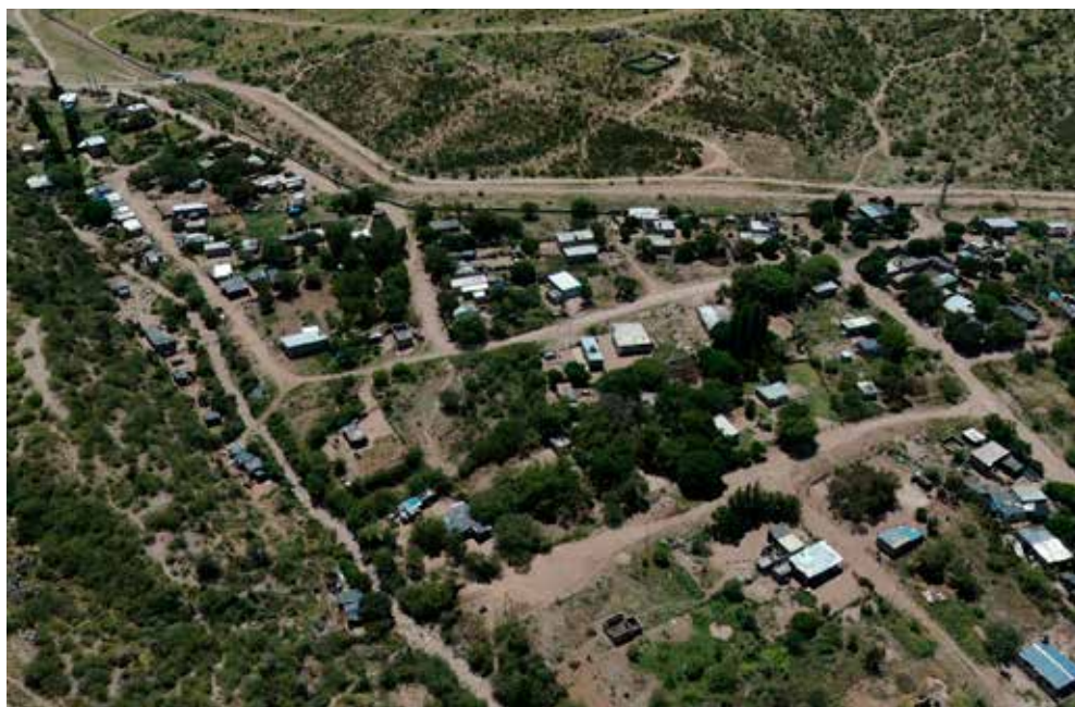
Figura 6. Barrios populares en el pedemonte noroeste.

Finalmente, los barrios populares tenían a principios del siglo XXI una escala reducida; ocupaban apenas 35 hectáreas, es decir, menos del 1% del área urbana total. Hacia 2010 sumaban 43 hectáreas, lo que significó un crecimiento del 20%, mientras que para 2022 experimentaron el crecimiento más significativo, prácticamente triplicaron su superficie y alcanzaron las 158 hectáreas. Si bien los barrios populares presentan una escala reducida en términos relativos dentro de la estructura urbana de la ciudad, representan la tipología residencial que más creció en el período analizado. La expansión de la informalidad se destaca especialmente en el pedemonte noroeste, la periferia este, vinculada a actividades productivas e industriales, y en el cuadrante sureste de la ciudad (Fig. 6).