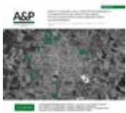
Imagen de tapa : Mapa de barrios populares con población indígena en J. J. Castelli (Chaco). Elaboración A&P Continuidad a partir de imagen realizada por Sebastián Galvaliz (2023).

ISSN 2362-6089 (Impresa) ISSN 2362-6097 (En línea)