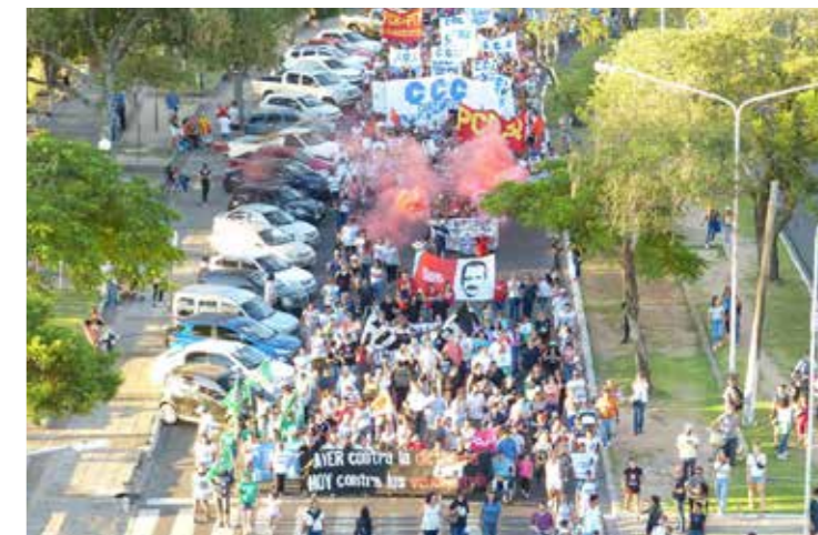
Figura 4. Marcha 24 de marzo, llegando al R19.

aprobación de la ordenanza. Fue rechazada en primera instancia, apelada por el colectivo y admitida el 10 de septiembre de 2019. Por complicaciones posteriores caducó en 2022 y la OPC continúa vigente. La gestión municipal hizo caso omiso del foro y los talleres, que obtuvieron la participación activa y financiamiento de algunos concejales opositores, aunque participamos también otros agentes como técnicos, integrantes de organizaciones sociales, sindicales, artísticas y personas no organizadas. Un objetivo estratégico de los organizadores fue componer un proyecto urbanístico alternativo, aunque este proceso movilizó múltiples discusiones internas. En las mesas de debate, aquello que estaba en juego, la forma de comprender problemáticas y de considerar posibilidades, difería en función de los distintos agentes. Algunas discusiones y propuestas estaban tan condicionadas por clase, género, edad, formación, que las subjetividades resultaban irreconciliables 11 . La agenda oficial continuó haciendo caso omiso a este proceso paralelo, desde fines de 2018 a principios de 2019, con mesas de trabajo a puertas cerradas 12 y dos actos de presentación del plan: en Casa de Gobierno con autoridades y prensa (Tassano, 1 de noviembre de 2018), y en Buenos Aires (en el Salón Federal CCK el 20 de noviembre de 2018). Este último, orientado a inversores inmobiliarios y turísticos (Argentina Prensa