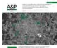
Imagen de tapa: Mapa de barrios populares con población indígena en J. J. Castelli (Chaco). Elaboración A&P Continuidad a partir de imagen realizada por Sebastián Galvaliz (2023).

ISSN 2362-6089 (Impresa) ISSN 2362-6097 (En línea)