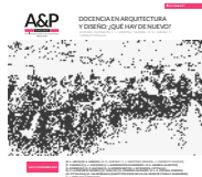
Imagen de tapa: Fotografía en el taller de clases. Edición A&P Continuidad.

ISSN 2362-6089 (Impresa) ISSN 2362-6097 (En línea)