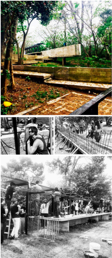
Figura 3. Plaza del Agua. Obra co-producida entre docentes y estudiantes del Taller Matéricos – Cátedra Valderrama y miembros de la comunidad de Bajada Barbi, Pueblo Esther.

desterritorializan y descorporizan. Esta hipótesis la prueba a partir de un estudio reciente en el que el médico y filósofo argentino convocó a dos grupos de taxistas, uno en Londres y otro en París. A los de París les solicitó navegar la ciudad sin GPS y a los de Londres, con GPS. Al cabo de tres años Benasayag y su equipo comprobaron que las terminales cerebrales de aquellos que utilizaban GPS se habían atrofiado debido a la