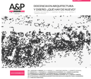
Imagen de tapa : Fotografía en el taller de clases. Autora: Agustina González. Edición A&P Continuidad.

ISSN 2362-6089 (Impresa) ISSN 2362-6097 (En línea)