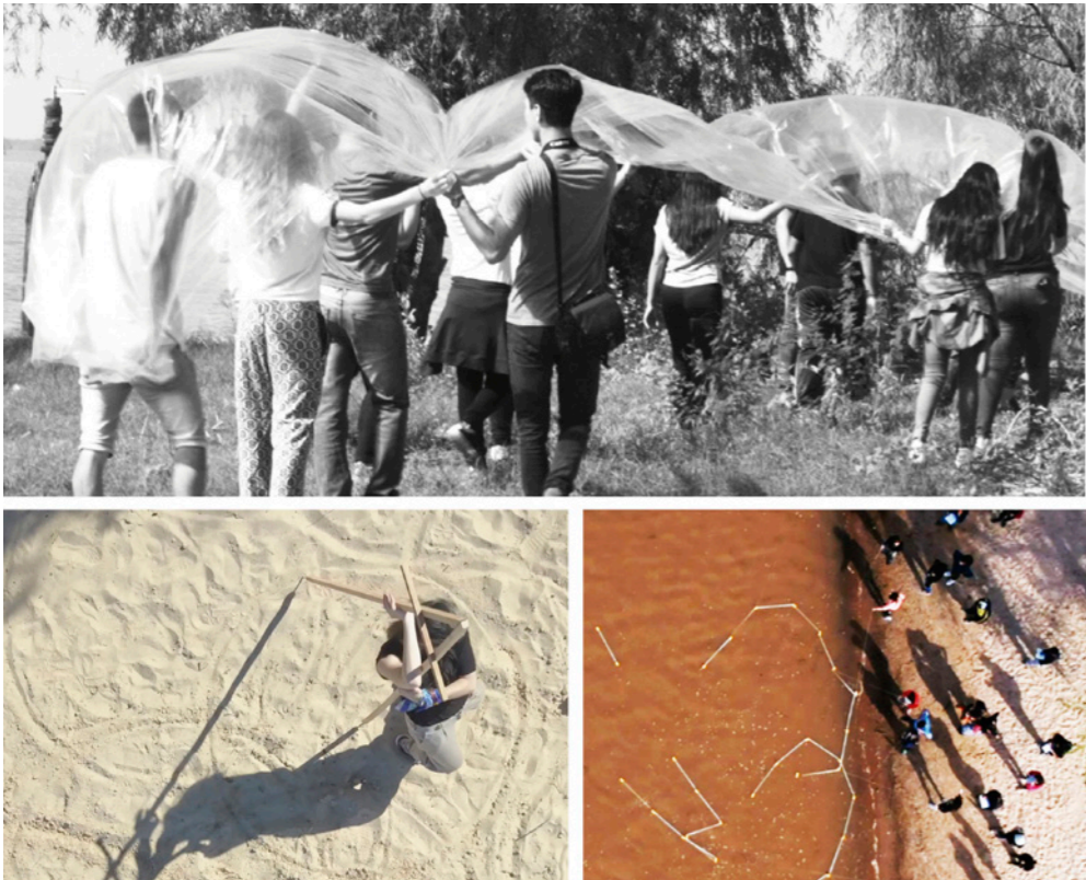
Figura 1. Derivas e inmersiones corporales. Estudiantes y docentes del Taller Matéricos – Cátedra Valderrama.

poder o impotentes. Bennett intenta demostrar que un entendimiento de la intencionalidad y capacidad de acción de la materia y las cosas más allá de la voluntad humana podría modificar los patrones de comportamiento sociopolíticos y ecológicos.