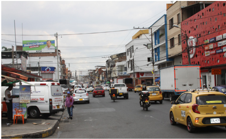
Figura 3. Proceso de densificación espontánea sector galería de la Alameda calle novena. Fotografía del autor. | Figura 4. Mixtura de usos comercio y vivienda a escala barrial carrera 23 barrio Junín. Fotografía del autor.