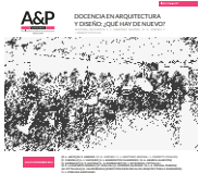
Imagen de tapa : Fotografía en el taller de clases. Edición A&P Continuidad.

ISSN 2362-6089 (Impresa) ISSN 2362-6097 (En línea)