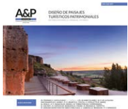
Imagen de tapa : Teatro romano de Clunia. Anticuario. Vista del pai- saje desde la galería trase- ra de la escena.