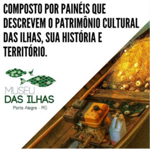
Figura 5: Imágenes de difusión recopiladas de redes sociales.

Enmarcado en el PEII Paisaje de islas: patrimonio y turismo comunitario como estrategia de desarrollo solidario, UNL (2021-2023) 17 lo insular es la idea que orienta el proceso de codiseño (Manzini, 2015) de la experiencia de turismo comunitario “La Boca: isla a puertas abiertas” que llevan adelante vecinas y vecinos y el equipo interdisciplinario de UNL. La patrimonialización de lo cotidiano 18 es la estrategia de valoración colectiva que busca generar consensos sobre la conservación del humedal, la conciencia de un territorio atravesado por ríos, el reconocimiento del paisaje cotidiano, las buenas prácticas de manejo de alimentos y residuos, la solidaridad, el trabajo digno y justo, son valores acordados comunitariamente. Durante los 3 km de