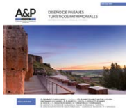
Imagen de tapa :

Teatro romano de Clunia. Anticuario. Vista del paisaje desde la galería trasera de la escena.