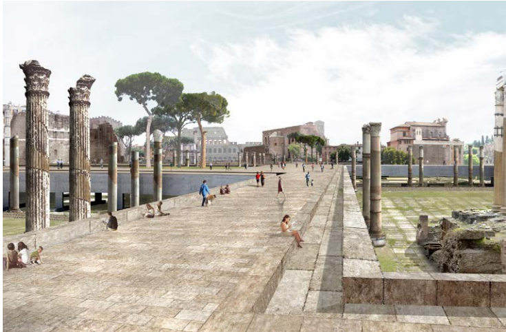
Figura 9. Foros Imperiales, eje hacia el Coliseo. Llamado internacional de proyecto "Progetti per la riqualificazione e risignificazione di Via dei Fori Imperiali" Piranesi prix de Rome 2016. | Figura 10. Museo del Ludus Magnus, Sección perspectivada de los diversos niveles. Llamado internacional de proyecto "Progetti per la riqualificazione e risignificazione di Via dei Fori Imperiali" Piranesi prix de Rome 2016.

Otra propuesta se refiere a la redefinición de la invasión del Coliseo mediante la modelización del suelo con el uso de una zona verde que delimite claramente el sistema vehicular de la zona arqueológica. Un último tema se refiere a la remodelación del Ludus Magnus, antiguo gimnasio de la gladatoria , y a la creación de un Antiquarium dedicado a los extraordinarios fragmentos de la Forma Urbis . La idea es unificar en un único sistema museístico tanto el Antiquarium como el espacio expositivo Forma Urbis, situados en el sitio arqueológico del Ludus Magnus. Esta solución permite proteger y valorizar el emplazamiento del Ludus Magnus, recreando la relación directa con el Coliseo que hoy se ve interrumpida por el anillo vehicular. La nueva estructura del museo, asentada sobre un gran basamento de plaza suspendida que domina el Coliseo, se estructura en dos cuerpos de edificios: el Antiquarium y el volumen transversal, que se integra en el fondo de la estructura expositiva Forma Urbis y en la conexión elevada entre los dos cuerpos laterales. La clara forma arquitectónica de los dos cuerpos del Antiquarium emerge del nivel del suelo de la plaza, trazando la geometría de los restos del Ludus Magnus. Esta se compone de un alto y estrecho muro hueco y de un volumen curvo que retoma la huella de la sección extruida de la