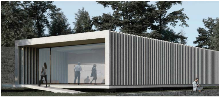
Figura 7. Tindari: Antiquarium, vista externa. Elaboración para el concurso “Progetto di Riqualificazione e Valorizzazione dell’Area Archeologica e Antiquarium di Tindari” 2020-2021. fachada sur sobre calle Santa Fe. | Figura 8. Tindari: Antiquarium, interior. Elaboración para el concurso “Progetto di Riqualificazione e Valorizzazione dell’Area Archeologica e Antiquarium di Tindari” 2020-2021.

Otra parte del proyecto consistió en resolver el problema del revestimiento de las salas con suelos de mosaico de la Insula IV y la Domus de Cercadenari. La protección de los ambientes se concibió mediante la creación de nuevos techos ligeros cuya geometría estructural pretende dar una idea de la volumetría original. Realizados en madera laminada con una estructura de vigas ligeras tipo Vierendeel, los techos están