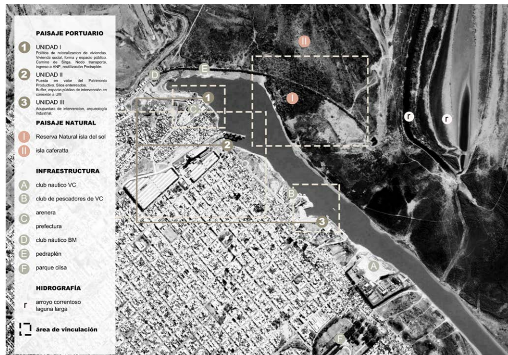
Figura 1. Área Objeto de Estudio. Análisis de sector.

río Paraná, con el canal de navegación, el puerto fragmentado en tres unidades espaciadas no continuas, la trama urbana y el Área Natural Protegida (ANP) que halla en la península de sedimentación unida a tierra firme (isla, humedal). De este modo, conviven el paisaje natural del territorio fluvial con el paisaje industrial y sus rastros arqueológicos. Es por ello que para el entendimiento del territorio-región, aquello que denominamos Atlas constituye una colección heterodoxa, una verdadera herramienta para las múltiples clasificaciones de paisajes heterogéneos, simultáneos, híbridos o, como hemos denominado, mestizos (Asorey, 2023).