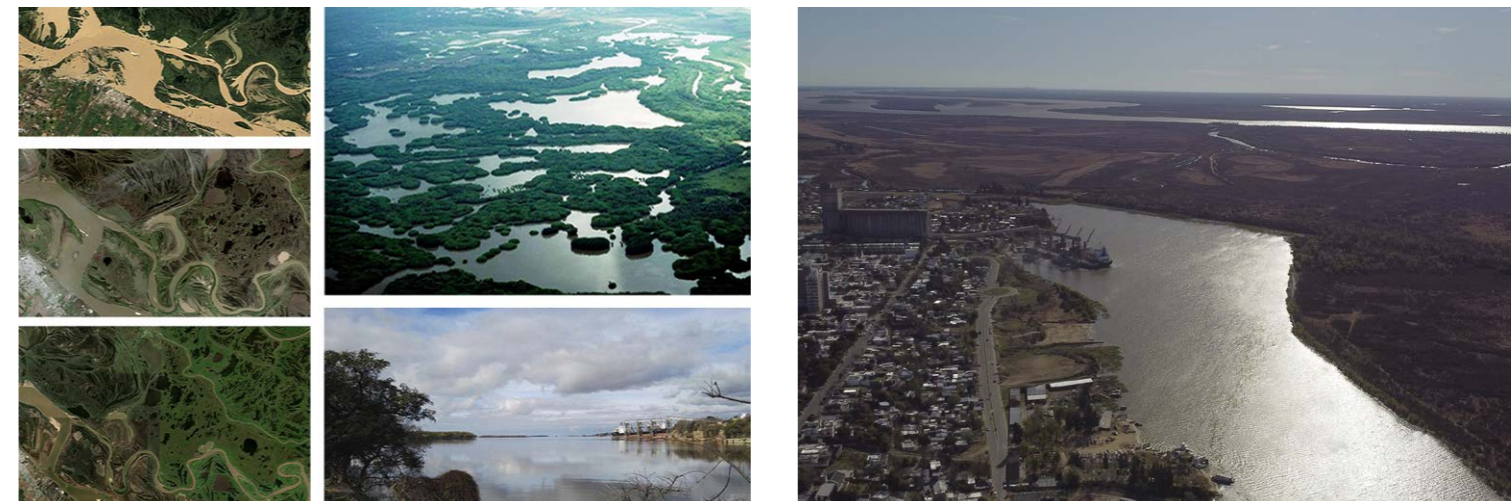
Figura 6. Paisaje hidrológico. Paisaje del Delta, vistas Isla del Sol ANP hacia Puerto Villa Constitución. Foto archivo de investigación. Extraído de Atlas (Asorey, G.). | Figura 7. Paisaje Oculito de la península del humedal. Imágenes Drone: Yair Giménez, Ente Administrador Puerto de Villa Constitución. Extraído de Atlas (Asorey, G.).

Sobre la base de los sedimentos transcritos, el paisaje mestizo es lo que manifestamos como lecturas interpretativas que indagan en unidades de patrimonio (gestión, acción, intervenciones), que no son solo las convencionales en cada una de las clasificaciones paisajísticas, sino según parámetros, valoraciones, cambios históricos y geográficos, cambios de uso, actitudes o procesos antrópicos transformadores de lo natural y de lo colectivo construido. En resumidas cuentas, el paisaje mestizo es propio de cada cultura y lugar (como aporte, herramienta, instrumento).