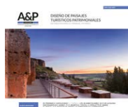
Imagen de tapa :

Teatro romano de Clunia. Anticuario. Vista del paisaje desde la galería trasera de la escena.