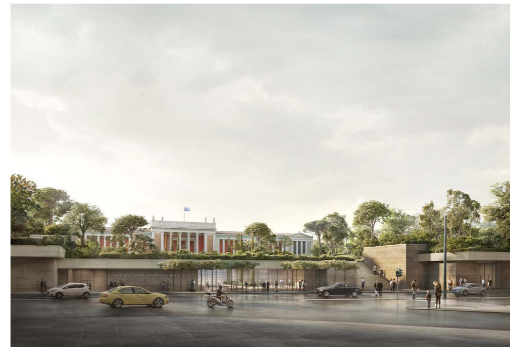
Figura 5. D. Chipperfield, Ampliación del MAN. El basamento habitado y la relación con la calzada.

Hubo también un proyecto presentado fuera de concurso y publicado por la revista helénica Tefchos , firmado por el arquitecto Ch. Papoulias (Papoulias, 1991). Este proyecto no consideró ninguno de los emplazamientos formulados en el anuncio. Entre todas las propuestas, esta fue la más radical, ya que preveía la localización del Nuevo Museo de la Acrópolis en la propia Acrópolis, en lugar del pequeño museo existente y del llamado colmata persiana , el terraplén creado después del 480 a.C. en las laderas surorientales