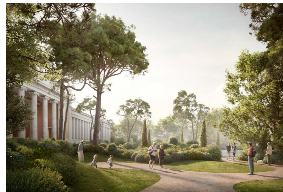
Figura 8. D. Chipperfield, Ampliación del MAN. El nuevo suelo.

El MAN, inicialmente un volumen libre por todos lados con un jardín neoclásico al frente rodeado de polikatoikie de posguerra, está encerrado dentro de una composición cerrada que se refiere a él, construyendo un (nuevo) contexto de referencia. A través de este basamento