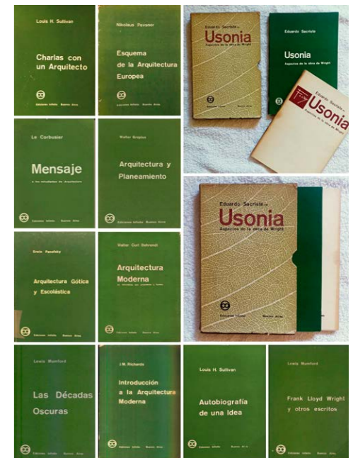
Figura 3. La Biblioteca de Arquitectura. Elaboración propia a partir de los libros revisados en la Biblioteca de la Editorial Infinito, en la Biblioteca Nacional y en la Biblioteca FAU UNLP.

La operación de marcado en este caso es evidente: Infinito reunió obras de diversas procedencias en una biblioteca con el mismo diseño de cubierta verde y con el mismo formato de 15 por 23 centímetros, lo que implica una imposición simbólica externa al texto en sí (Fig. 3). Los libros, al igual que en la colección ya comentada, fueron accesibles: todos valían, según el catálogo de 1961, entre 130 y 330 pesos, a excepción del de Pevsner que era mucho más largo (350 páginas) (550 pesos), y el de Sacriste (420 pesos), que contó con dos partes: el libro propiamente dicho y un sobre con la documentación de las obras a modo de apoyo gráfico, ambos dentro de una caja. La Biblioteca de Planeamiento y Vivienda fue creada por Jorge Enrique Hardoy y contaba con seis títulos hacia el final del recorte temporal que aquí trabajamos: La ciudad es su población de Henry Churchill (1958), La metrópoli en la vida moderna en cuatro tomos de Richard Neutra, Donald Young, Joseph Folliet y otros (1958), Planeamiento urbano de Thomas Sharp (1959), Cómo concebir el urbanismo de Le Corbusier (1959), Ciudades en evolución de Patrick Geddes (1960) y La ciudad del futuro de Le Corbusier (1962) (Catálogo Ediciones Infinito, 1966). La biblioteca es un reflejo del debate que estaba atravesando la disciplina urbanística a mediados