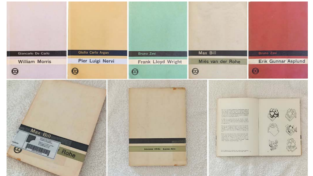
Figura 1. Isotipo Ediciones Infinito. Carlos Méndez Mosquera, 1953. | Figura 2. Colección Arquitectos del Movimiento Moderno. Elaboración propia a partir de los libros revisados en la Biblioteca de la Editorial Infinito, en la Biblioteca Nacional y en la Biblioteca FAU UNLP.

protagonista, tomaron ventaja de las condiciones favorables del mercado editorial e iniciaron un emprendimiento que resultó ser el primero en su tipo en el ámbito hispanohablante (Fig. 1). Al poco tiempo del derrocamiento de Perón en 1955 comenzó un proceso de reformas y profunda actualización en todas las universidades nacionales. En la UBA, los jóvenes que participaron en la discusión de la política universitaria durante el peronismo y plantearon en las aulas la necesidad de una actualización disciplinar, fueron quienes, ya graduados, accedieron paulatinamente a los organismos representativos universitarios, permitiendo la instalación en este ámbito institucional del discurso moderno y un consecuente abandono de toda referencia a la arquitectura clásica. El modelo desarrollista impulsado en la universidad estimuló también esta situación: la importante posición institucional de los estudiantes, los concursos docentes, los nuevos institutos de investigación y facultades, una editorial propia (Eudeba) y la construcción de la ciudad universitaria instalaron un terreno propicio para la producción científica y cultural. Fue así que algunos de los fundadores de Infinito se incorporaron como docentes en la Escuela de Arquitectura y Urbanismo de Rosario: Carlos