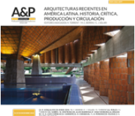
Imagen de tapa : Interior del bloque de hidroterapia de la Fundación Teletón Paraguay (2008-10).

ISSN 2362-6089 (Impresa) ISSN 2362-6097 (En línea)