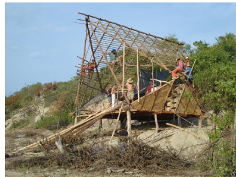
Figura 4. Casa 001, Al Borde Arquitectos. | Figura 5. Minga construyendo la Escuela Nueva Esperanza, Al Borde arquitectos.

en las comunidades operando mediante intervenciones puntuales y limitadas, a modo de acupuntura. La muestra dio un fuerte impulso a la colocación en el centro de la escena internacional a estudios como Elemental (Chile), Lacaton y Vassal (Francia) y Francis Kéré (Burkina Faso), que luego llegaron a ganar el premio de consagración mainstream por excelencia: el Pritzker (en 2016, 2021 y 2022, respectivamente). El curador de esta muestra, Lepik, continuó promoviendo en los años siguientes esta clase de proyectos 14 . Además, en 2012 coorganizó la muestra Participation: Empowerment in Practice en la Harvard University Graduate