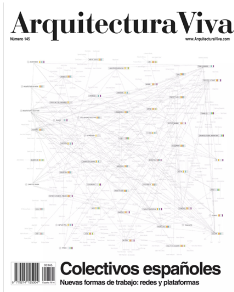
Figura 6: Tapa del libro Small scale, Big change del MoMA. Recuperado de: https://books.google.es/books?id=IOkRt2VhnLYC& | Figura 7: Tapa del número 34 de Harvard Design Magazine. Recuperado de: http://www.harvarddesignmagazine.org/issues/architectures-of-latin-america/ | Figura 8: Tapa del número 145 de la revista Arquitectura Viva. Recuperado de: https://arquitecturaviva.com/publicaciones/av/colectivos-espanoles .

Por otro lado, Zaera Polo (2012, p. 258), en una descripción y catalogación general de la arquitectura contemporánea que realizó para la revista El Croquis , denomina activismo precioso a una de las categorías que propone. Allí nunca utiliza la noción de colectivos de arquitectos.