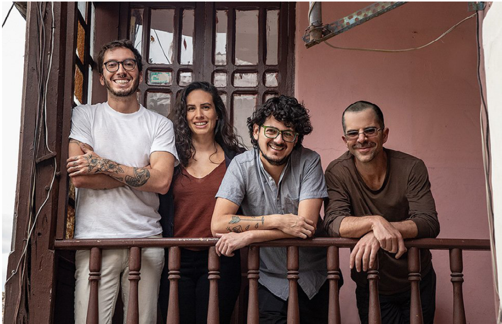
Figura 1. Integrantes de Al Bordo.