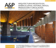
Imagen de tapa : Interior del bloque de hidroterapia de la Fundación Teletón Paraguay (2008-10).

ISSN 2362-6089 (Impresa) ISSN 2362-6097 (En línea)