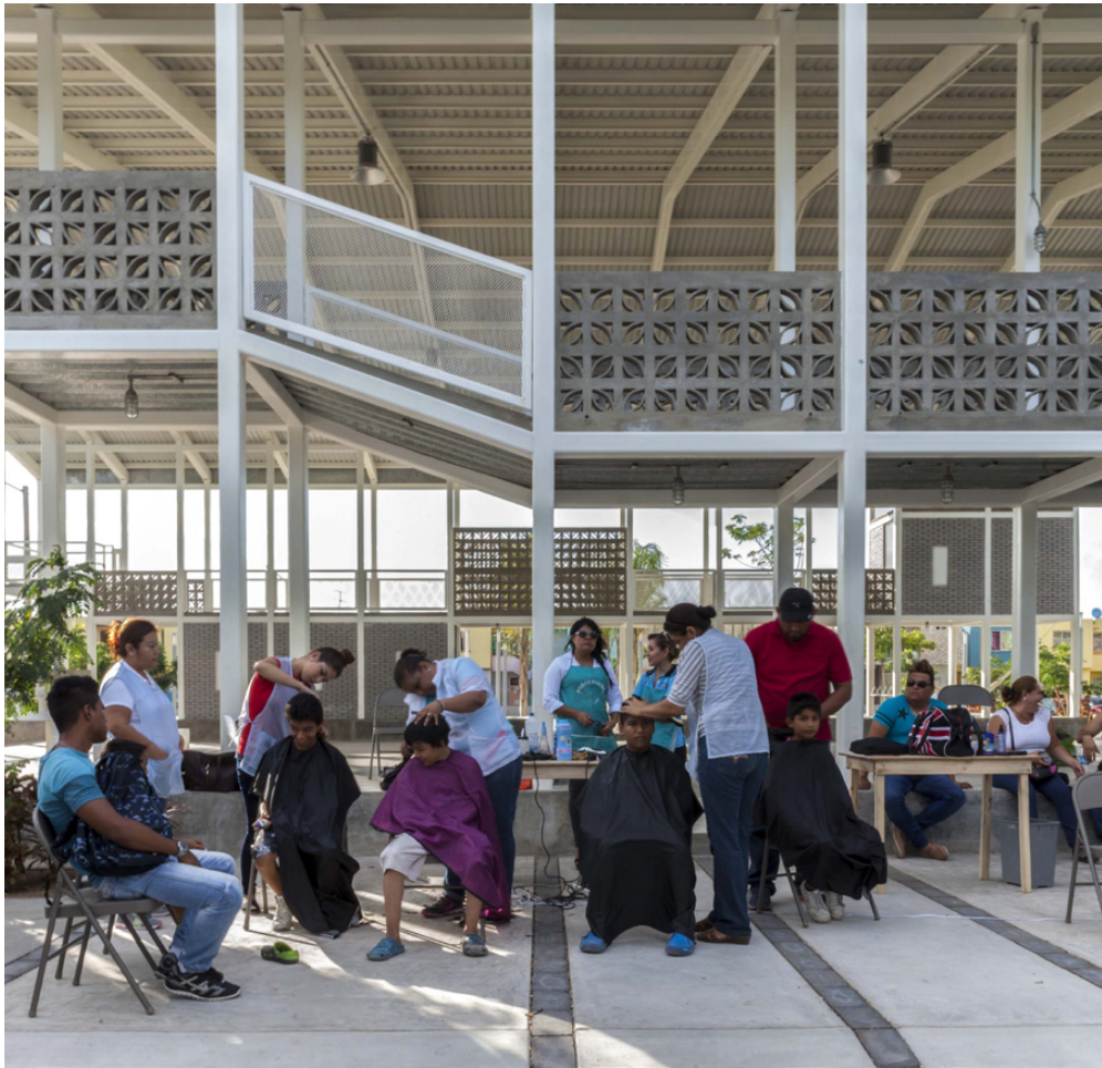
Figura 8. Apropiación para actividades comunitarias de la cancha deportiva, Cancha, diseñada por la arquitecta Rozana Montiel, en Lagos de Puerto Moreno, Veracruz, México, en 2016.

ninguna limitación de acceso; por el contrario, el entorno es una invitación a ser, como una parada en el camino de aquellos que están de paso por la región, como agricultores u otros trabajadores rurales, ofreciendo agua y sombra para el descanso, o para la ocupación de estudiantes que extrapolan el uso del espacio interno y utilizan áreas abiertas también como espacio de aprendizaje. En este sentido, la escuela cuenta con espacio para una pista deportiva, jardines y laboratorios. El bloque central más pequeño alberga un espacio polivalente que se abre a ambos bloques laterales, escuelas primarias y secundarias, y garantiza la integración con las