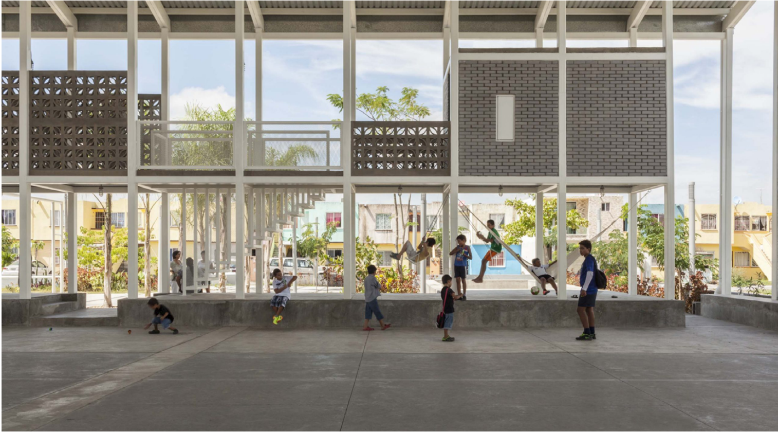
Figura 9. Espacios de usos múltiples en perímetro de cancha deportiva comunitaria. Proyecto Cancha, diseñado por la arquitecta Rozana Montiel, en Lagos de Puerto Moreno, Veracruz, México, en 2016.

Los tres bloques son espacios cubiertos que reproducen las chozas tradicionales de la región, hechas esencialmente de madera y paja. La necesidad inicial de la comunidad era una escuela alineada con la cultura local. Esto generó la construcción del primer edificio en 2009, apodado barco , pero cuyo nombre fue Escuela Nueva Esperanza. Las siguientes construcciones ganaron nuevos programas capaces de consumir la vocación inicial de centro comunitario. Así, el término centro comunitario apareció directamente en la comisión del segundo bloque, la serpiente o Esperanza Dos (2011), cuyo espa-