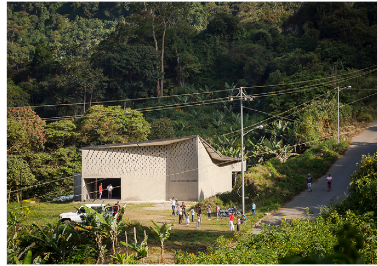
Figura 6. Vista de la plaza de acceso y entrada a la Iglesia de San Juan María Vianney. | Figura 7. Vista aérea del Taller Comunitario de Costura Amairis y sus alrededores.

La vocación de desempeñarse como centro comunitario se potencia cuando las escuelas se ubican en territorios vulnerables que carecen de infraestructura institucional y espacios públicos que permiten reuniones para este fin. Hay una serie de escuelas construidas en los últimos años en Latinoamérica, cuya participación comunitaria ocurre tanto en la ocupación del edificio, como en diferentes momentos de su