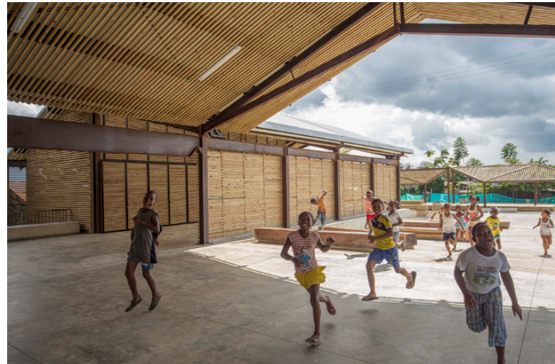
Figura 3. Niños asomados a las ventanas de las aulas de la Escuela Santa Elena de Piedritas. | Figura 4: Niños corriendo por el espacio abierto del Parque Educativo Vigía del Fuerte.

Es a partir de ahí que puede proponer una nueva visión y un nuevo trabajo. Está en una excelente posición para proporcionar acceso a la arquitectura, como producto y servicio, a lo excluido, lo oculto, lo reprimido. También es una posición privilegiada con relación a los cambios que se han producido en nuestro tiempo, en los que la comparación del edificio o la ciudad con el cuerpo ya está desfasada].