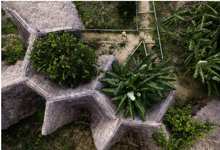
Figura 1. Espacio abierto y acceso a las aulas en la Escuela Primaria y Secundaria El Huabo. | Figura 2. Vista aérea de la serpiente o Hope Two, segundo edificio del complejo Las Tres Esperanzas.

tetura, ao urbanismo e às artes. Apesar disso, uma primeira questão a ser colocada refere-se a um aspecto recorrente em praticamente todas as revistas: a dificuldade de identificação das profissionais, uma vez que foi comum encontrar casos em que os nomes delas se encontravam incompletos ou abreviados, não apareciam nos sumários (e sim nos artigos no meio das revistas) ou mesmo não se usava o adjetivo feminino; em um exemplo deste último foi o uso da palavra arquitecto , embora se tratasse de profissionais mulheres (Espinoza, 2022, p.175-176) [La encuesta realizada en las revistas especializadas permitió identificar y sacar a la luz un número significativo de mujeres que trabajan en diversos campos, especialmente vinculados a la arquitectura, el urbanismo y las artes. A pesar de esto, una primera pregunta que debe hacerse se refiere a un aspecto recurrente en prácticamente todas las revistas: la dificultad de identificar a las profesionales, ya que era común encontrar casos en que sus nombres estaban incompletos o abreviados, no aparecían en los resúmenes (sino en los artículos