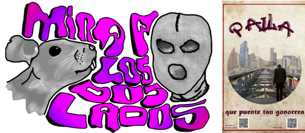
Figuras 9 y 10. Sticker y poster realizado por alumnos de la materia en colaboración con el movimiento urbano Métele pedal para visibilizar inconvenientes relacionados a la seguridad de los peatones en localidades colombianas. Imágenes recuperadas de: https://movimientosurbanos227872659.wordpress.com/2022/05/11/recorridos-fragmentados/