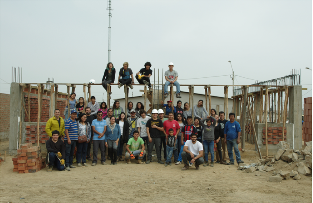
Figura 7. Construcción del centro Nuevo Amanecer en Cajamarquilla, Lima.