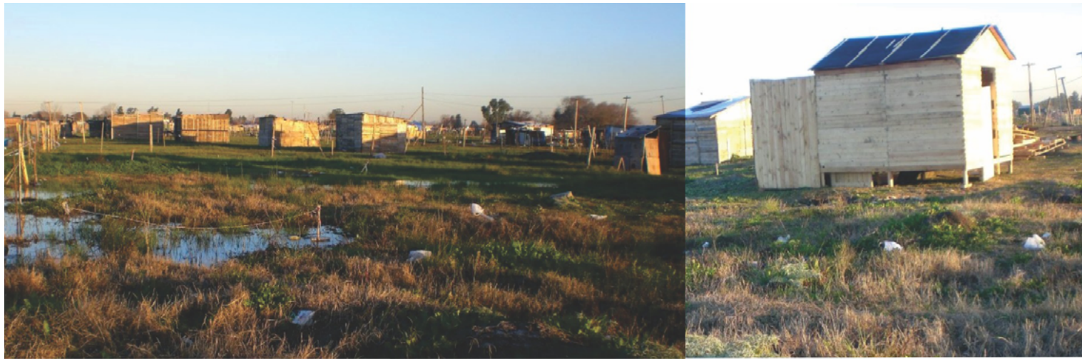
Figura 5. El barrio a unos meses de la ocupación.

Al mes del inicio de los loteos y ocupaciones ya se registraban cerca de 800 casillas precarias y carpas, tanto al oeste del arroyo (barrio SL) como al este (barrio UNK) tal como lo muestra el plano realizado a partir de la puesta en contraste de diversas imágenes satelitales (Fig. 2). Puede verse la vivienda del cuidador al centro por el acceso en la calle Las Tres Marías, con un sector que no se ocupó en su entorno, ya que el cuidador opuso resistencia a la toma. Además de los rellenos, cavas y basurales del terreno, se distingue una serie de canchas de fútbol en el perímetro del predio que eran utilizadas por los vecinos de los barrios cercanos. Si bien los trazados aún se encuentran poco definidos, se puede apreciar una distribución de lotes que en