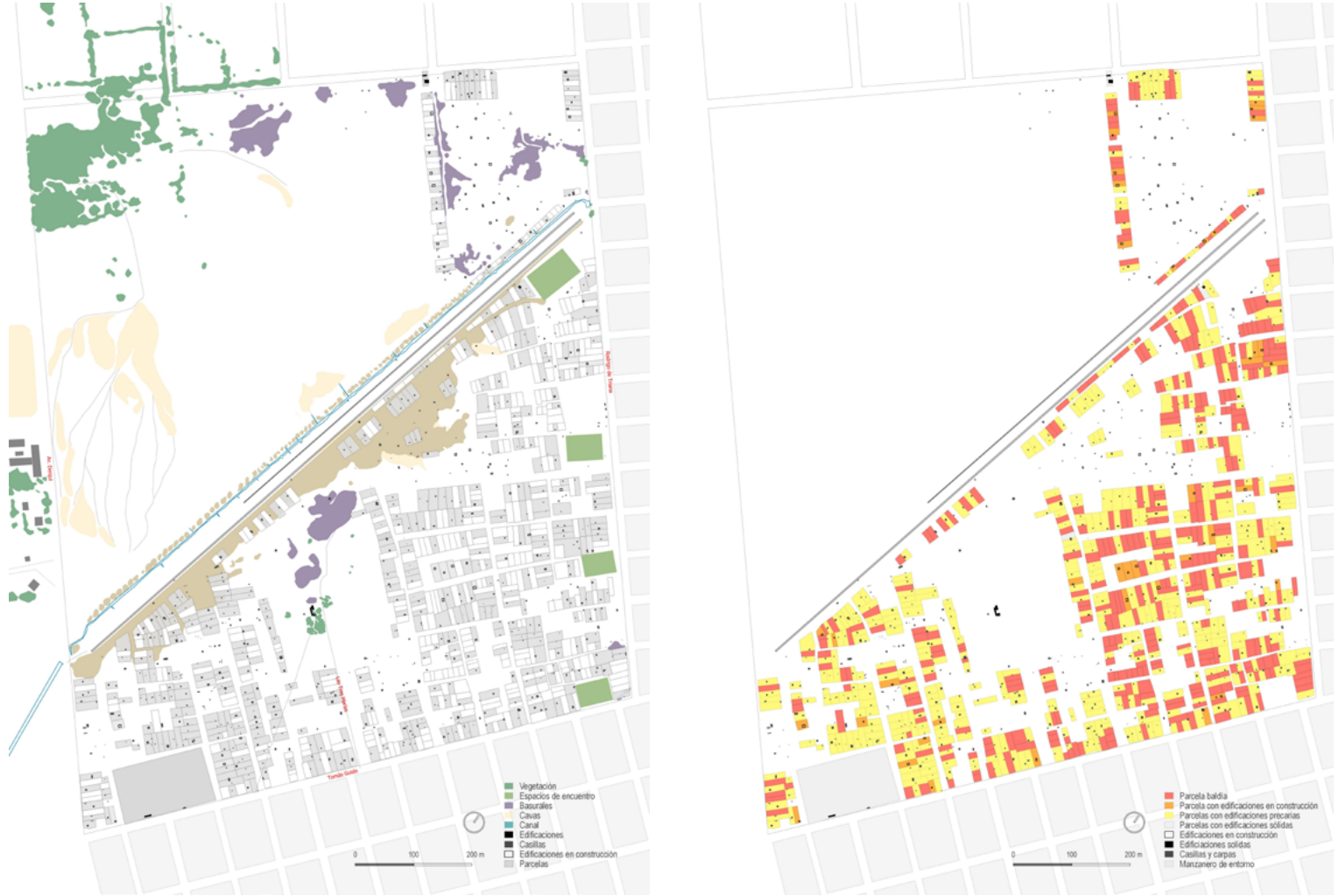
Figura 2. Los barrios a un mes de su origen en 2012. Fuente: Elaboración propia (2022). | Figura 3. Los barrios a un mes de su origen en 2012. Las relaciones entre edificaciones y parcelación. Fuente: Elaboración propia (2022).

ción de tipo jerárquica, racional y estática de sus acciones y políticas (Lascoumes y Le Galès, 1984). Bajo ese prisma de la “acción pública”, se entiende, tal como lo señala Thoenig (1997) que el poder público no tiene el monopolio de lo político, y las transformaciones –en este caso la extensión de los asentamientos– “se da en una ‘arena’ en la cual coexisten diferentes lógicas y valores, modalidades muy diversas, coyunturas e intervenciones planificadas, racionalidad técnica y elecciones políticas, experticias científicas y compromisos militantes, programación y concertación” (p. 30). A partir de ello, los entramados actorales de cada momento del proceso se deben considerar en esas relaciones entre actores, en una escala que va más allá del propio barrio y de quienes lo habitan, ya que los actores del entramado lo constituyeron todos los que se encontraron implicados en el proceso de construcción de los barrios (entendiendo que esta construcción no es lineal y que algunos actores operaron en su construcción desde la oposición al desarrollo del barrio en los términos en que se dio). En lo metodológico, la puesta en contraste de diferentes imágenes satelitales, de distintos