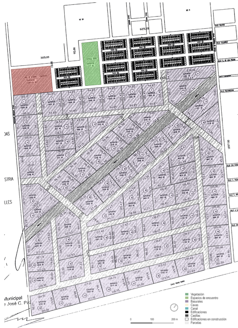
Figura 6. El Master Plan del parque industrial.