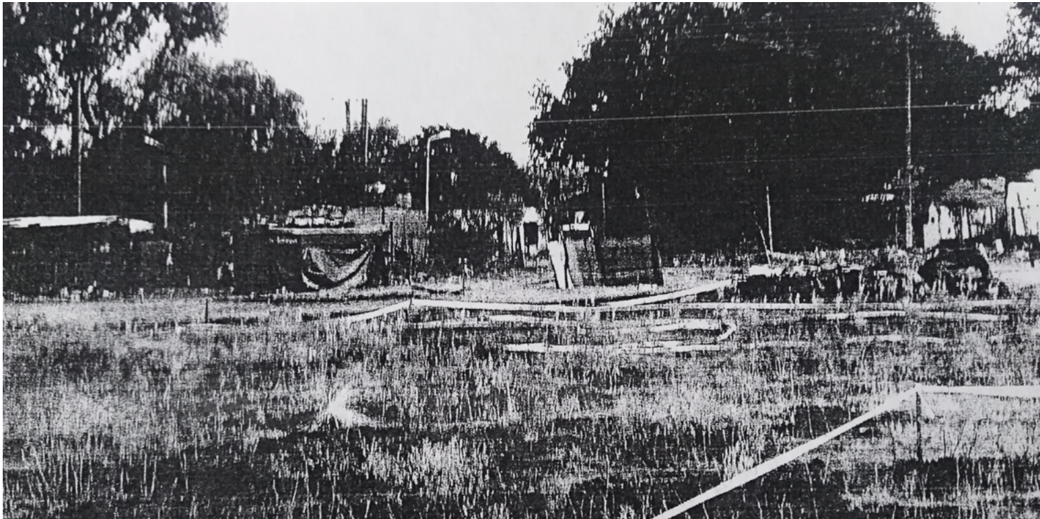
Figura 4. Primeras ocupaciones.

durante el tiempo que Carlos Urquiaga lo sucedió luego de haber ganado las elecciones en el año 2011. Estos intendentes impulsaron diversos proyectos vinculados a salud y educación, así como también se gestionó la instalación de viviendas de interés social con financiamiento del gobierno nacional.