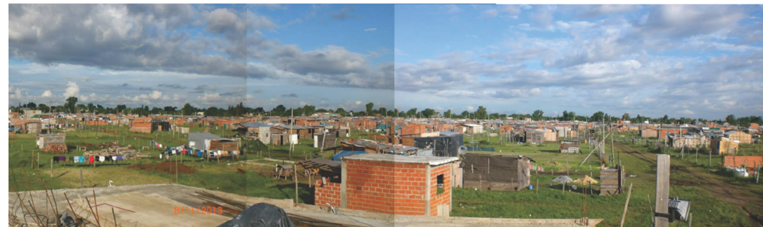
Figura 7. El barrio a fines del año 2013.

El barrio proyectado, en la tensión entre posibles adjudicatarios y desalojados En el segundo momento, diferentes instituciones desarrollaron proyectos sobre el predio, inicialmente con la mediación del poder judicial. Más adelante, el gobierno municipal junto a los propietarios, formularon un convenio por el cual acordaban la construcción de un parque industrial en el predio, lo que implicaría la relocalización de parte de la población en un sector del mismo. La posibilidad de aprobación del convenio implicaba el acuerdo con los habitantes del barrio, que debían aceptarlo en una mesa de mediación dispuesta por el juez. Ello generó divisiones en la organización vecinal entre quienes podrían ser adjudicatarios de los lotes en la relocalización (Ciudadanos con domicilio en JCP) y quienes podrían ser desalojados (todos los habitantes del barrio que no tuvieran domicilio en JCP). A continuación, se describirá en detalle. Frente a la denuncia de los propietarios del predio, se abre una causa caratulada como de usurpación , entendiendo así que el hecho se había dado mediante el ejercicio de violencia y/o en clandestinidad sobre un inmueble del que se estaba haciendo efectivo ejercicio de posesión por parte de los damnificados (propietarios). Si bien ello no era un dictamen final, permitió ordenar el desalojo de los ocupantes . Ordenado el desalojo, la Comisión Nacional de