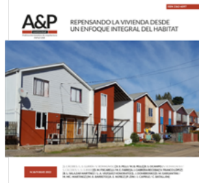
Imagen de tapa : Villa para trabajadores de empresa forestal en la Comuna de Constitución (vivienda progresiva diseñada por Elemental).

A&P Continuidad fue reconocida como revista científica por el Ministero dell'Istruzione, Università e Ricerca (MIUR) de Italia, a través de las gestiones de la Sociedad Científica del Proyecto.