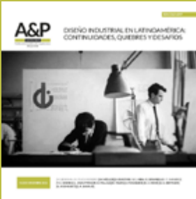
Imagen de tapa : Espacio de trabajo en el Instituto de Diseño Industrial de Rosario.