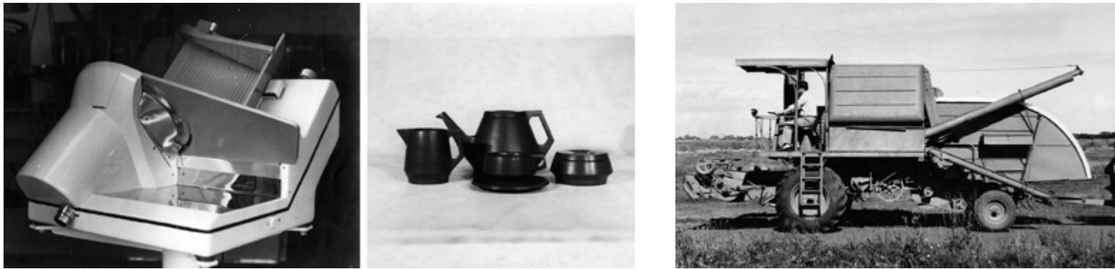
Figura 5. Diseños. Cortadora de fiambres y diferentes piezas de juego de té. | Figura 6. Diseños. Cosechadora.