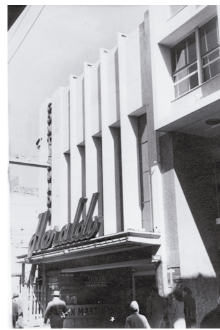
Figura 1. San Lorenzo 1157 | Figura 2. Corrientes 650 | Figura 3. Cine Heraldo.