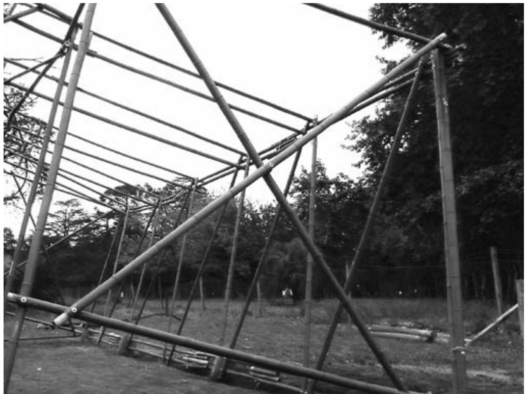
Invernáculo-aula. PH. A. Buzaglo. Parque Villarino, Zavalla, 2013.

· Valladares, L. (2002). Cantando las Raíces . Buenos Aires: Emecé.