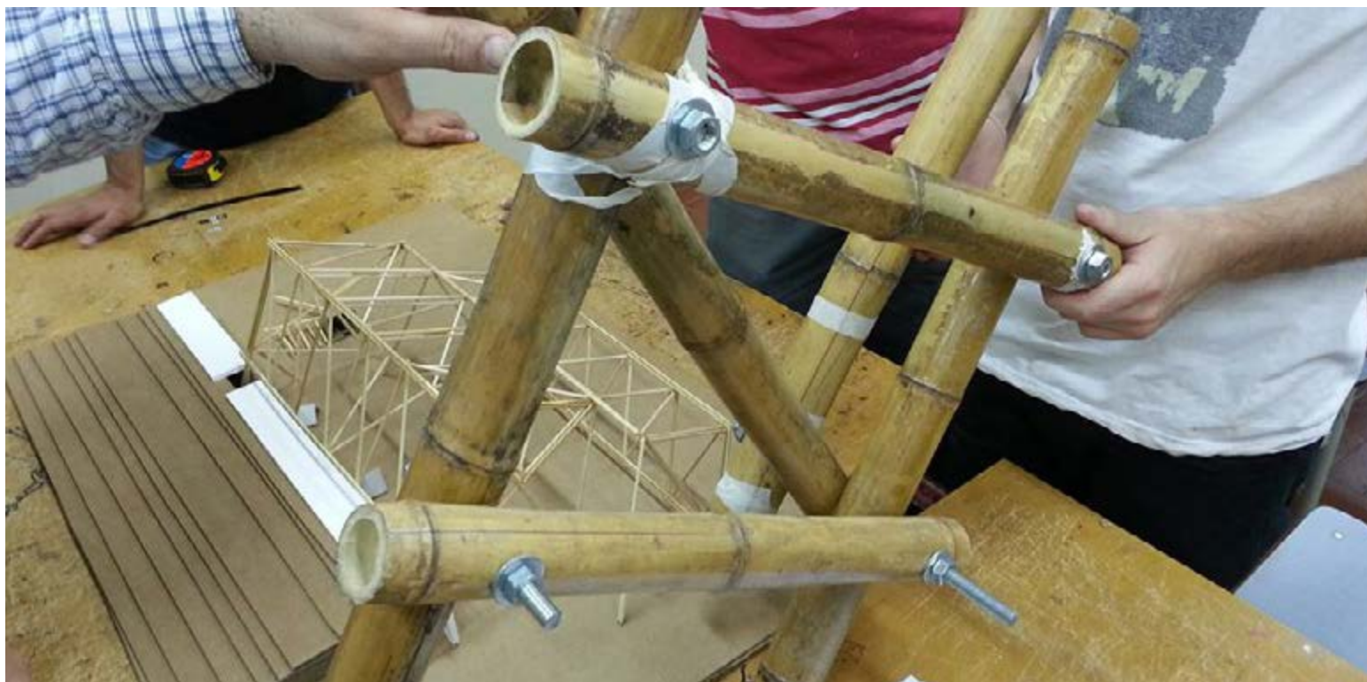
Invernáculo-aula. Estudio de los nudos. Parque Villarino, Zavalla, 2013