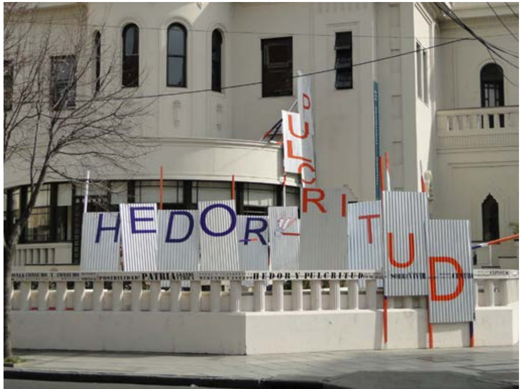
Instalación. Museo de la Memoria, Rosario. 2012.

interdependientes: los distintos sujetos, la cultura, la topografía, el territorio, las técnicas, los materiales, los costos, la logística que hace posible la construcción.