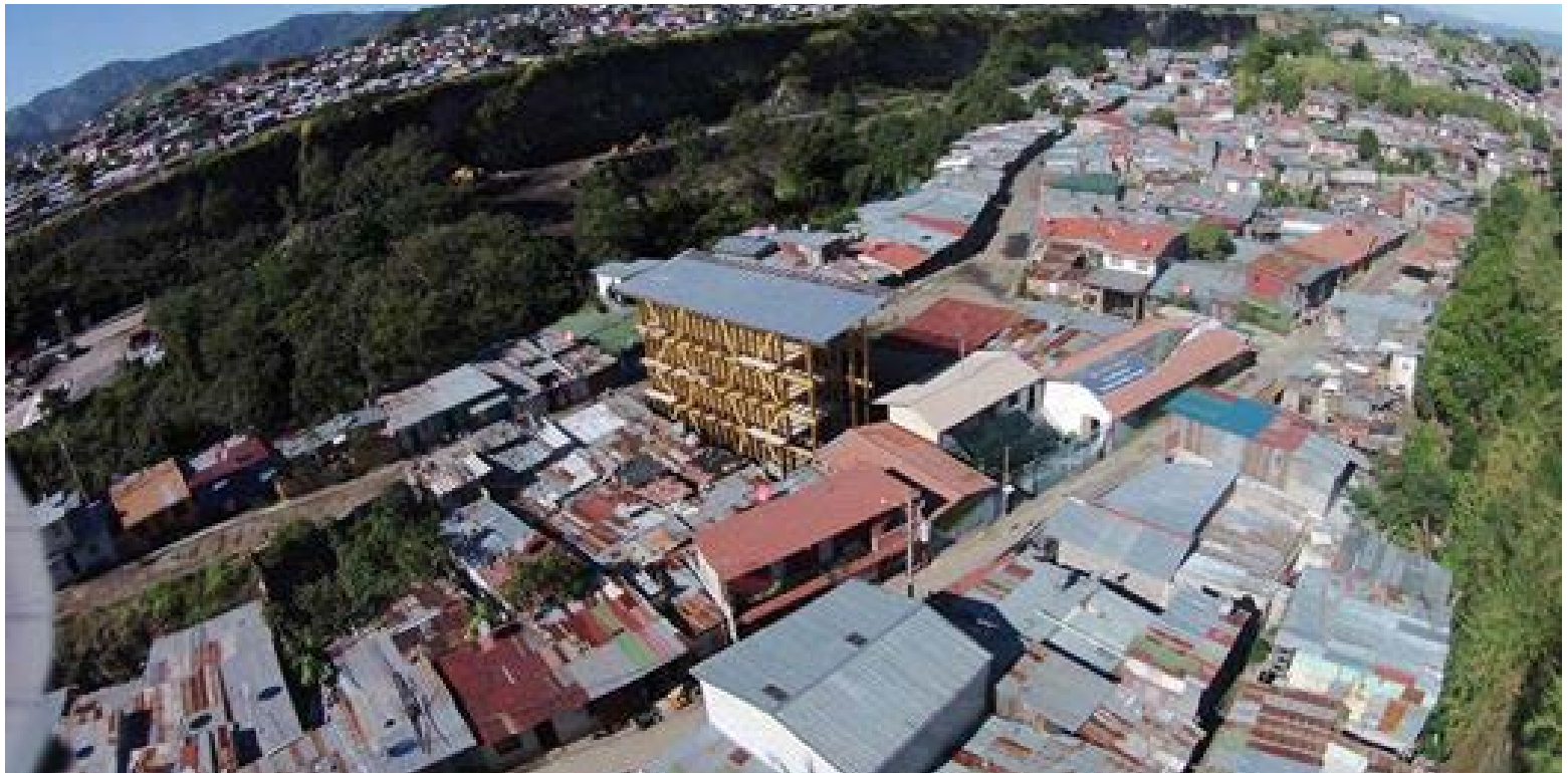
Escuela de música de La Carpio.

Niño” que, bajo la consigna de “repensar la relación entre la arquitectura y las nuevas formas de aprendizaje”, cuestionaba desde la denominación misma del encargo al programa de hogar-escuela o escuela de tiempo completo enunciado en las bases. Entre Nos se suma a esta suerte de estado de la cuestión proyectual de obras que están repensando la relación entre la arquitectura, las infancias y las nuevas formas de transmisión del conocimiento, presentando en su exposición el manual de diseño para el Sistema Nacional de la Red de Cuido de Costa Rica, el centro de cuidado para el desarrollo infantil de Nicoya, la escuela de música de la Carpio y el centro de capacitación indígena KÄPÄCLÄJUI.