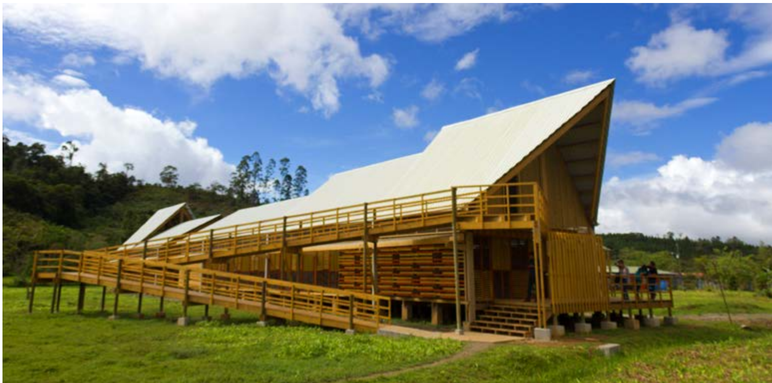
Centro de capacitación indígena KÄPÄCLÄJUI