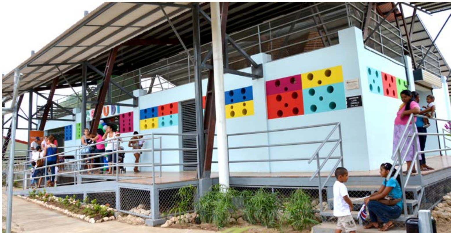
Centro de cuidado para el desarrollo infantil de Nicoya , 2001, Nicoya, Gadacaste, Costa Rica. Fotos: Pamela Zamora / Renders: Entre Nos