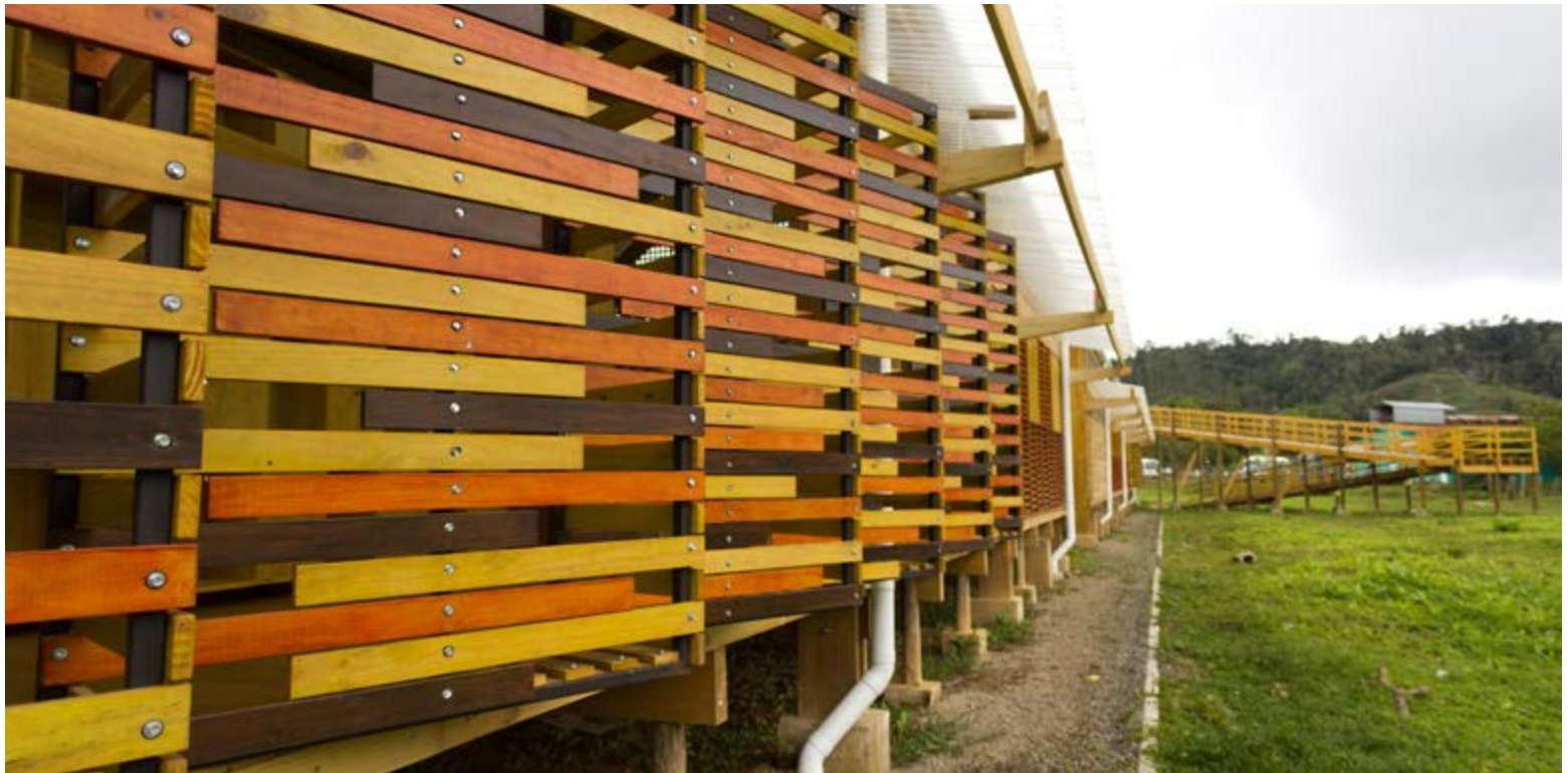
Centro de capacitación indígena KÄPÄCLÄJUI

observado, interpretado y decodificado al entorno, a los habitantes y a las distintas concepciones de hábitat que representan. Desde esta perspectiva la arquitectura no es un lujo. Sí es una excusa para construir relaciones humanas y comunidad, con la convicción que, desde la disciplina, pueden generarse soluciones prácticas y económicas a las necesidades conocidas. Sí es una vigorosa fuente de recursos humanos y socio-económicos con notable impacto sobre el hábitat sociocultural. Sí es una herramienta de cambio, accesible y replicable.