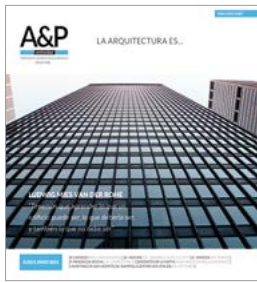
Imagen de tapa :