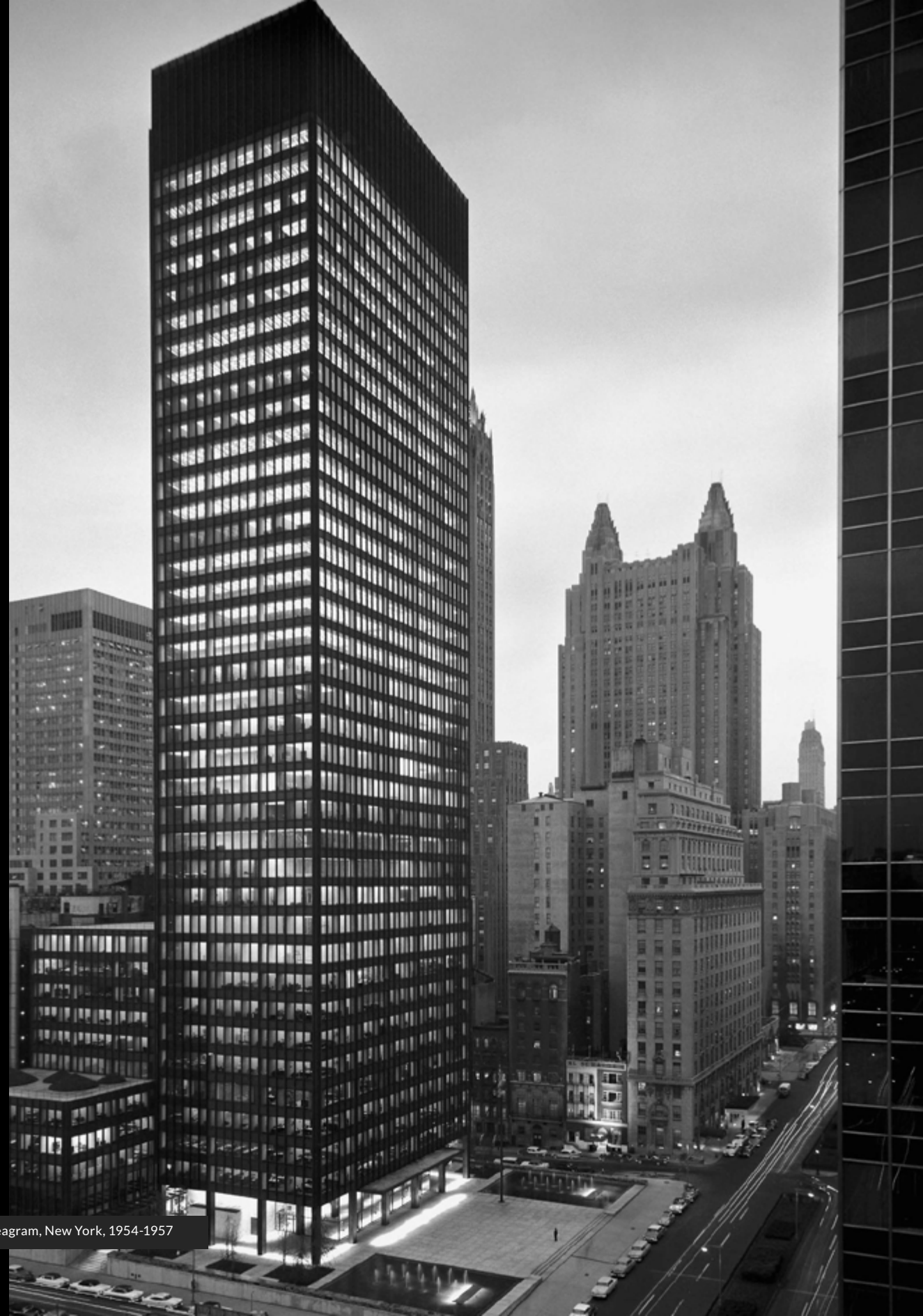
Edifício Seagram, New York, 1954-1957